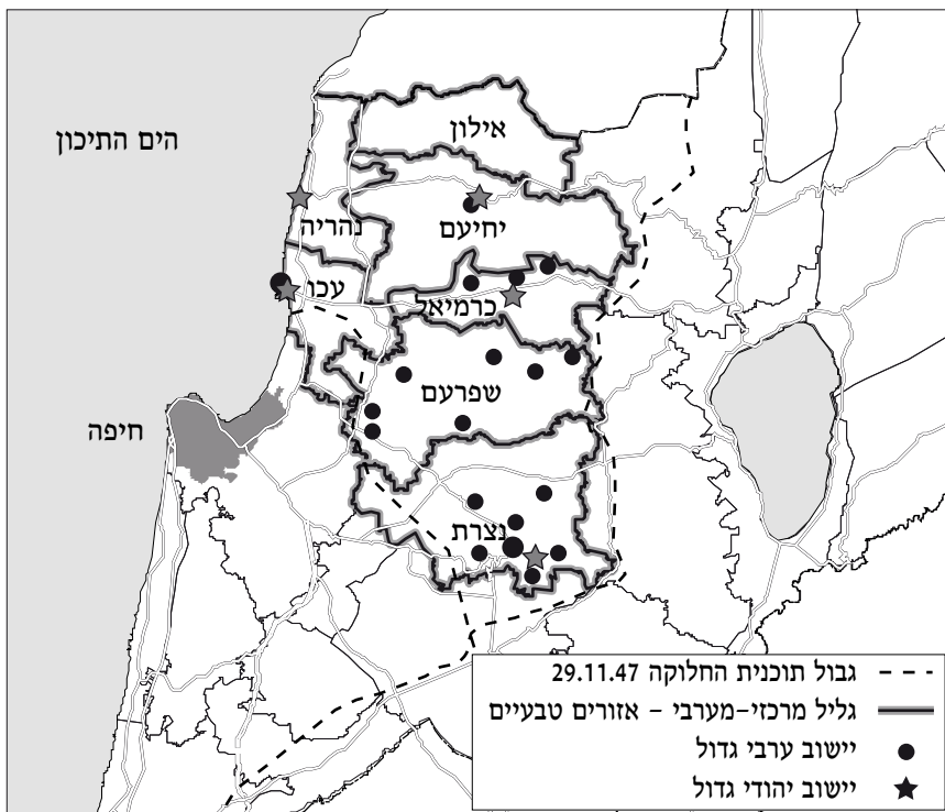
מפה 2: הגליל - אזורים סטטיסטיים

שיעור האוכלוסייה הערבית-מוסלמית במרחב הגליל המרכזי, כהגדרתו כאן, נע סביב 75% מהאוכלוסייה. שיעור האוכלוסייה היהודית אינו מגיע ל-25% מהאוכלוסייה (מדובר באזורים טבעיים של הלמ"ס - כרמיאל, שפרעם, ונצרת). שיעור זה נותר פחות או יותר בעינו, אם מצמצמים וממעטים את הגדרת הגליל המרכזי, דהיינו מרחיבים את הגליל המרכזי לאזורים טבעיים כיחיעם ואילון, כלומר כל הגליל העליון המרכזי יחד עם הגליל התחתון.