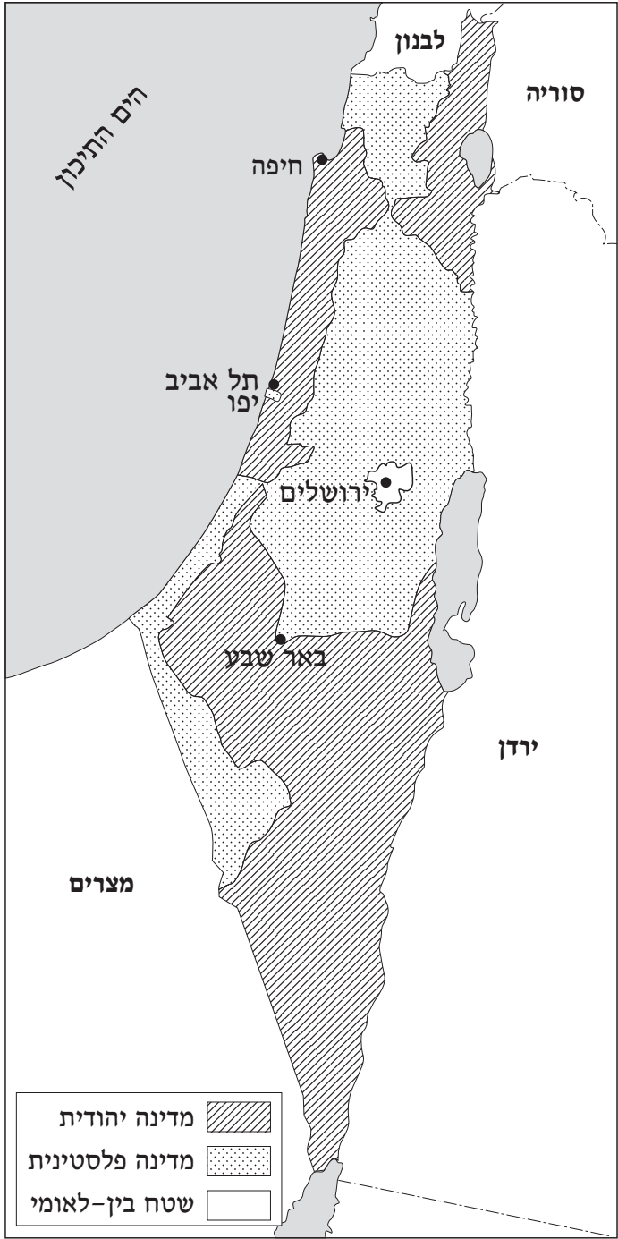
מפה 1: תוכנית החלוקה של 1947